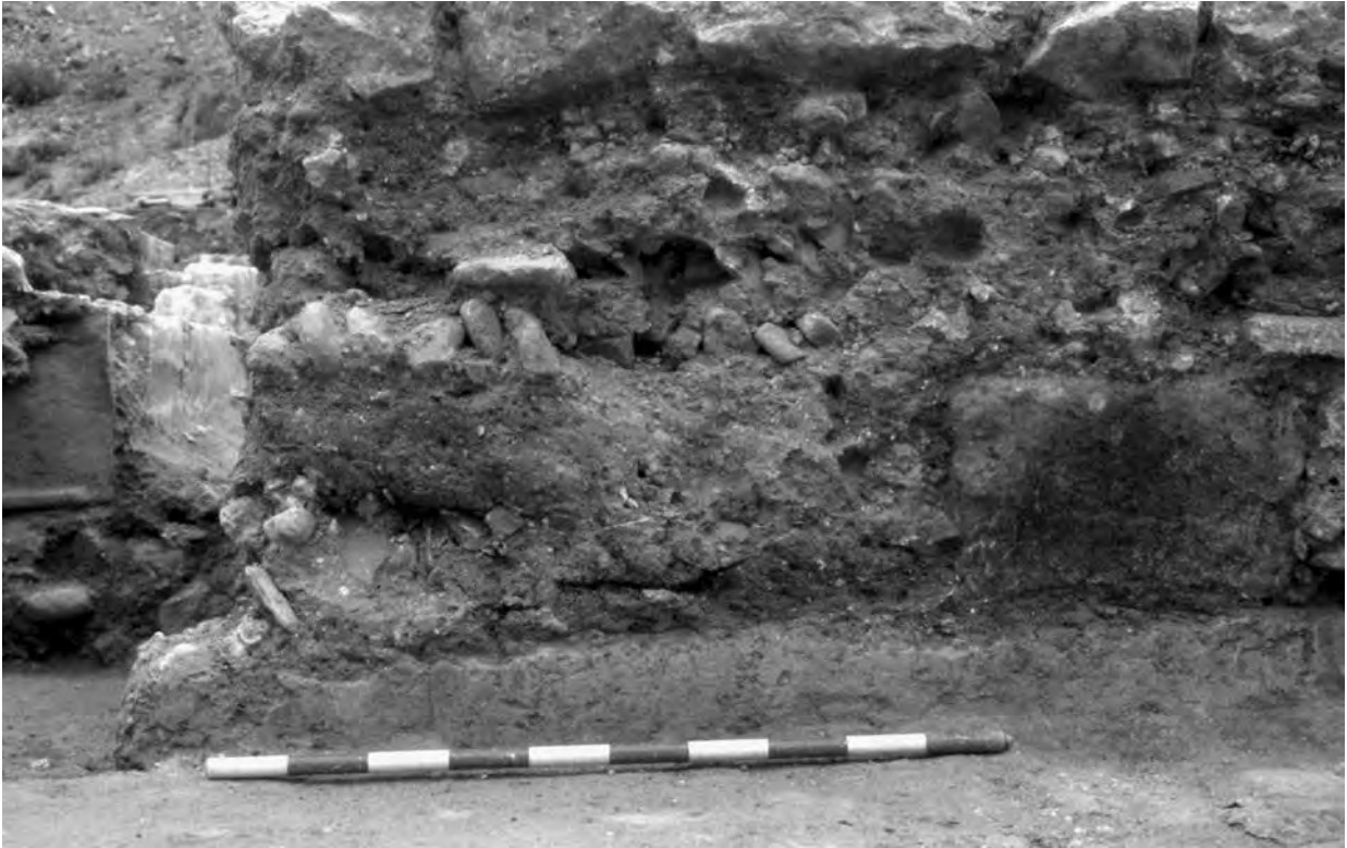
Figura 4. Detall dels nivells d'enderroc de la parcel·la 31 (PERI-2).