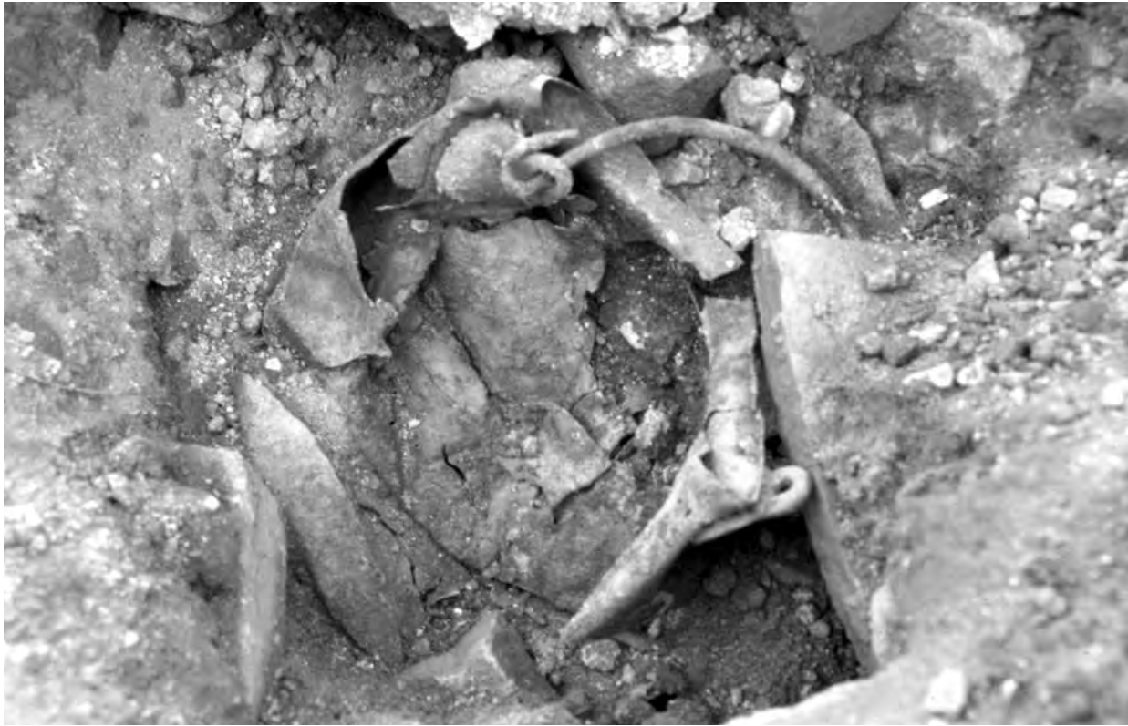
Figura 2. Objectes de bronze recuperats a la cuina de la domus de la parcel·la 31 (PERI-2).