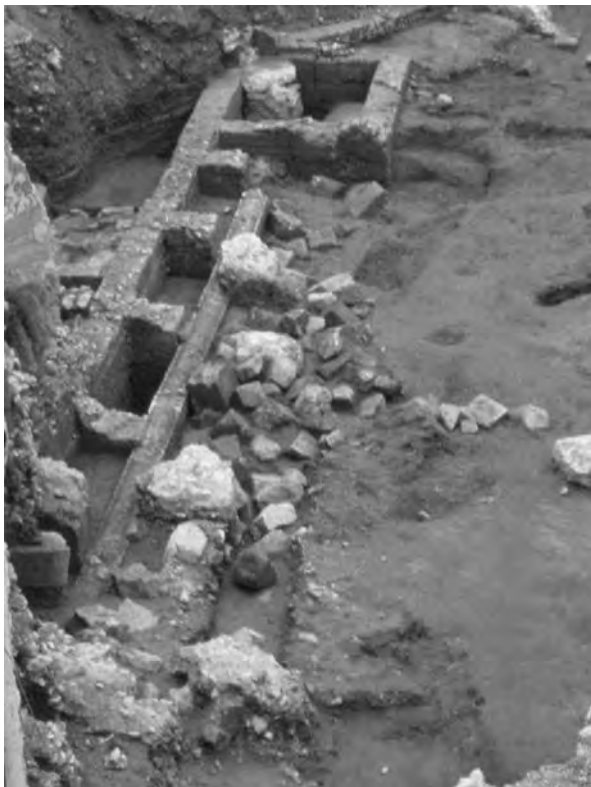
Figura 3. Detall de l'abocador d'elements constructius generat després d'un incendi.

col·lapse de la xarxa pública de distribució d'aigua i eliminació de residus. Tant les canalitzacions d'aigua com la xarxa de clavegueram pública (i també les escomeses fetes per particulars) deixaren de ser operatives. Això també afectà la font pública de la cruïlla dels carrers de Pere Martell i d'Eivissa (fig. 5), on la coberta ensulsiada durant el segle III dC no fou retirada i romangué sobre el paviment de la piscina limaria , de manera que impedia l'accés de l'aigua als brolladors (Pociña i Remolà, 2003).