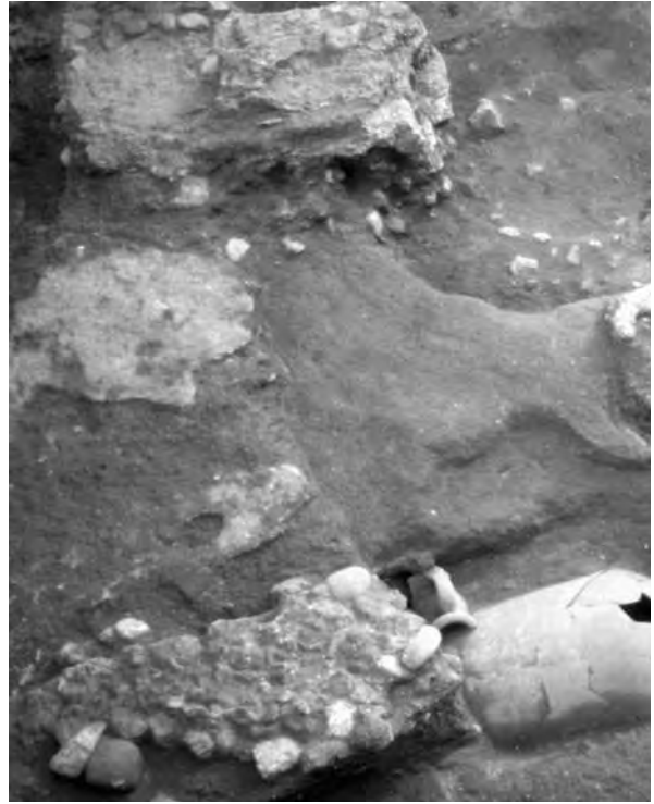
Figura 7. Conjunt d'enterraments de l'àrea portuària occidental.

A partir del final del segle IV o l'inici del v, es detectà una reactivació urbanística que afectà l'extrem més occidental del suburbi portuari, que es va estendre pel marge esquerre del riu Francolí, on es desenvolupà el complex eclesiàstic que conformen les basíliques i les àrees d'enterrament identificades durant la construcció de la fàbrica de tabacs (denominada Necròpolis Paleocristiana ) i del centre comercial Parc Central. Sobre les terrasses al·luvials del riu Francolí, i prop del nou suburbi portuari, es desenvolupà un extens nucli cristià iniciat a partir d'una memoria dels màrtirs locals —Fructuós, Auguri i Eulogi— i la formació posterior d'una tumulatio ad sanctos , prop del que s'ha