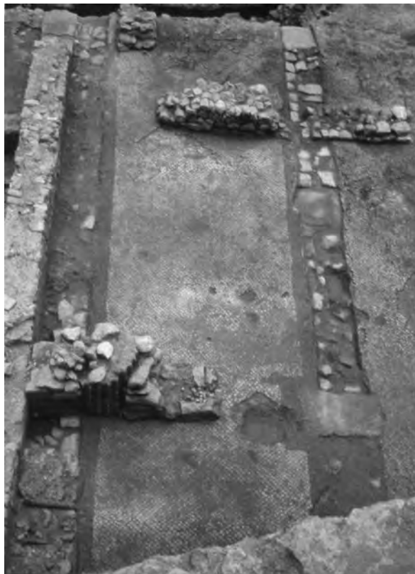
Figura 10. Estructures domèstiques tardoantigues sobreposades a les termes del carrer de Sant Miquel.

tant per l'àrea occidental com per l'oriental, la perdurabilitat d'aquest suburbi fins a les acaballes de la ciutat clàssica. D'altra banda, les dades econòmiques que reflecteixen les importacions ceràmiques indiquen una societat imbricada en els corrents comercials i ideològics de l'època. És simptomàtic, per als darrers segles de la ciutat visigòtica, la influència creixent del món oriental, constatada a partir de restes epigràfiques i ratificada a partir d'un increment de les importacions amfòriques i de ceràmica comuna (Macias, 1999; Remolà, 2000).