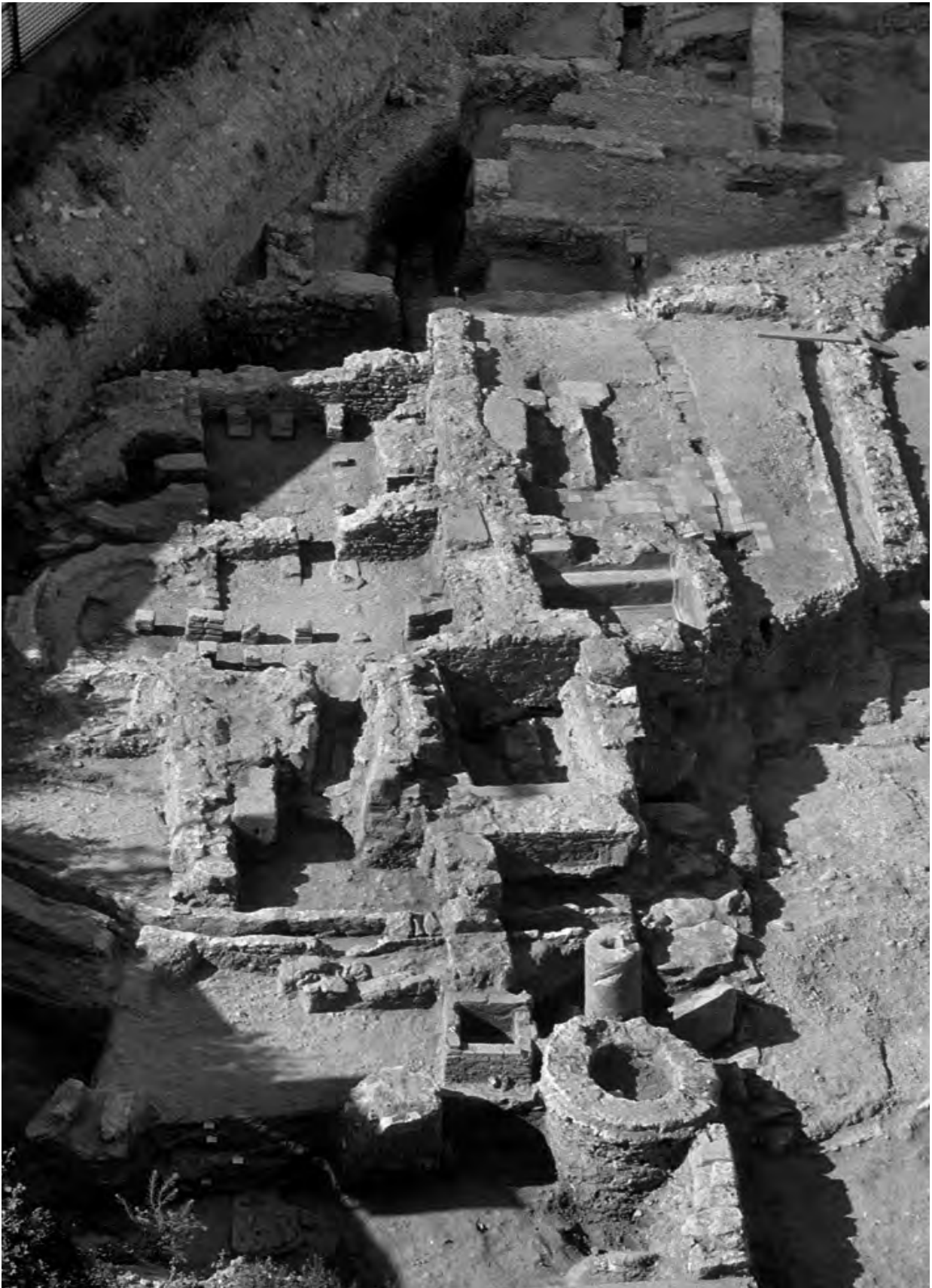
Figura 9. Vista general de les termes de la parcel·la 32 (PERI-2).