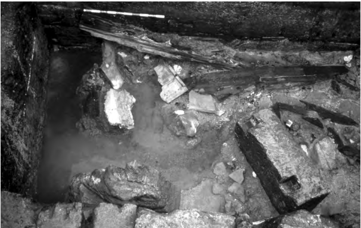
Figura 5. Detall de la coberta ensulsida de la font.