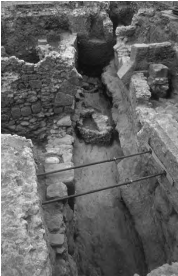
Figura 6. Vista del col·lector principal de la ciutat.

De forma pràcticament consecutiva, es constata la presència d'activitats de recuperació de material arquitectònic. La superfície formada pels nivells d'enderroc fou perforada i remoguda pels recuperadors de material constructiu i altres menes de materials i objectes. Aquesta activitat es concentrà especialment en els angles i els pilars dels edificis, fets d' opera quadrata . El marbre, els metalls i el material ceràmic de construcció foren també peces cercades pels recuperadors. Al mateix temps, es constatà la formació de petites àrees funeràries (fig. 7), tal com demostra l'excavació d'un sector suburbial proper a la ciutat (Garcia i Remolà, 2000). Aquest sector era creuat per les vies d'accés des del sud i des de l'oest i, desproveït d'una altra destinació urbanística, va esdevenir un lloc apte per a la formació d'àrees funeràries, al costat de les vies encara en ús i en altres punts, que, hipotèticament, podem relacionar amb límits de propietat. Generalment, es tracta de petites concentracions d'enterraments, en fossa i amb caixa d'àmfora o de tegulae , que no sembla que tinguin gaire con-